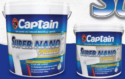
▲ 2.5 ลิตร ▲ 1 ลิตร

กัปตัน ซุปเปอร์ นาโน โพรเมอร์ : สีรองพื้นปูนเก่าและปูนใหม่ (สูตรน้ำ) เกรดพรีเมียม เป็นสีรองพื้นปูน ที่ได้มีการพัฒนาใช้เนื้อฟิล์มสีขาว เหมาะสำหรับพื้นผิวปูนเก่าภายในและพื้นผิวปูนใหม่ภายนอก ด้วยเนื้อฟิล์มสีขาวคุณภาพสูงทำให้ปกปิดพื้นผิวปูนได้อย่างดีเยี่ยม ช่วยในการกลบรอยและช่วยต่อมารถางานมากขึ้น และยังเพิ่มประสิทธิภาพให้ฟิล์มสีทับกันที่มีรอยร้าวที่เดิมช่วยลดความเสียหายตามความต้องการพร้อมด้วยเทคโนโลยี นาโน เรซิน (Nano Resin) จากนวัตกรรมใหม่ของกัปตัน ช่วยเพิ่มประสิทธิภาพในการยึดเกาะได้ดีที่สุด ป้องกันปัญหาฟิล์มสีเป็นฟองอากาศ และฟิล์มสีลอกหลุด ช่วยยืดอายุการใช้งานให้ยาวนานยิ่งขึ้น ป้องกันการเกิดคราบเกลือและคราบต่างๆได้อย่างมีประสิทธิภาพ ไม่เกิดกลิ่นฉุน จึงปลอดภัยจากสารพิษ และไม่มีส่วนผสมของสารตะกั่วและปรอท จึงมั่นใจได้ว่าปลอดภัยสำหรับผู้อยู่อาศัยอย่างแน่นอน