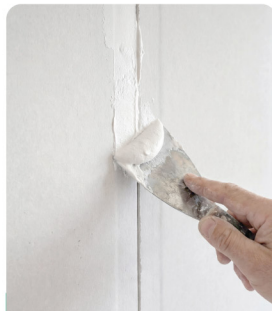
รอยต่อแผ่นยิปซัม