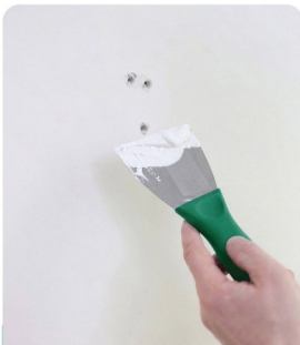
รอยหัวตะปู รุ่ย รุน