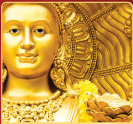
อลูมิเนียม