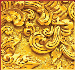
ปูนซีเมนต์

สีทองอะคริลิก สูตรน้ำมันแห้งเร็ว พลสมผสานกับผงทองคำสูตรพิเศษ จากอเมริกา ให้สีทองสุกเปล่งประกายเงาจากตั้งทองคำแท้ เนื้อทองเป็นประกาย ให้การยึดเกาะพื้นผิววัสดุได้ดีเยี่ยม เงาจาก กนแดด กนฝน กนทาน ต่อรอยขีดข่วน เนื้อสีลื่นไม่จับฝุ่น เนื้อสีมากทาได้พื้นที่มาก