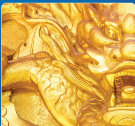
ปูนปลาสเตอร์