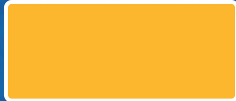
EP333 สีเหลือง