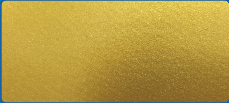
สีรองพื้นอะคริลิก สูตรน้ำ