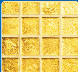
กระเบื้องแผ่นเรียบ