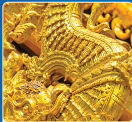
ปูนซีเมนต์