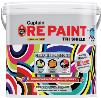
(ขนาดบรรจุ : 1, 2.5 และ 5 แกลลอน)