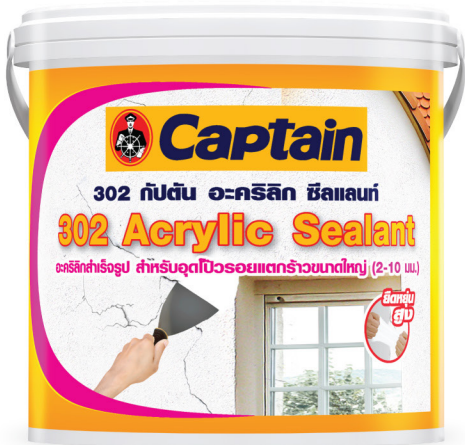
( ขนาดบรรจุ: 1 กิโลกรัม )