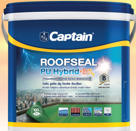
( ขนาดบรรจุ : 4 , 20 กิโลกรัม )