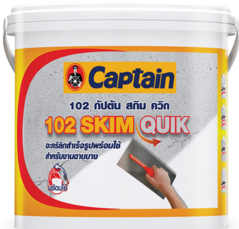
( ขนาดบรรจุ: 5 , 25 กิโลกรัม )