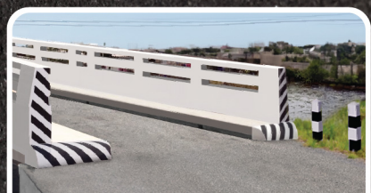
สะพานคอนกรีต หลักนำทาง