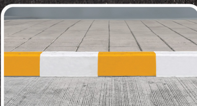
ขอบถนน ฟุตบาท