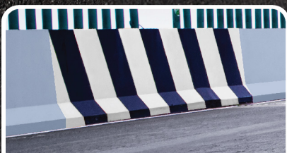
แบริเออร์คอนกรีต

สีน้ำอะคริลิกพร้อมรองพื้นในตัว สำหรับทาคอนกรีต งานจราจร